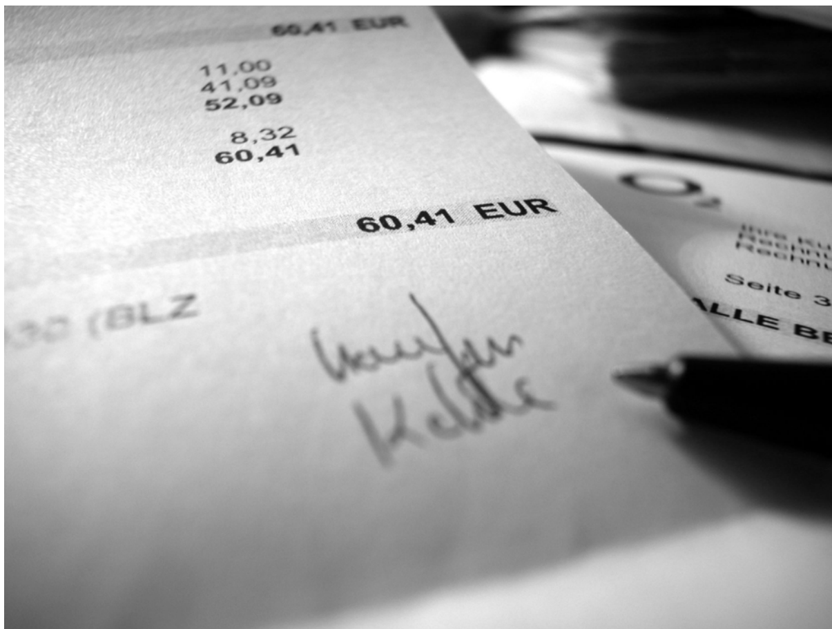
Generazione ed esportazione di documenti di pagamento con Radix Homebanking