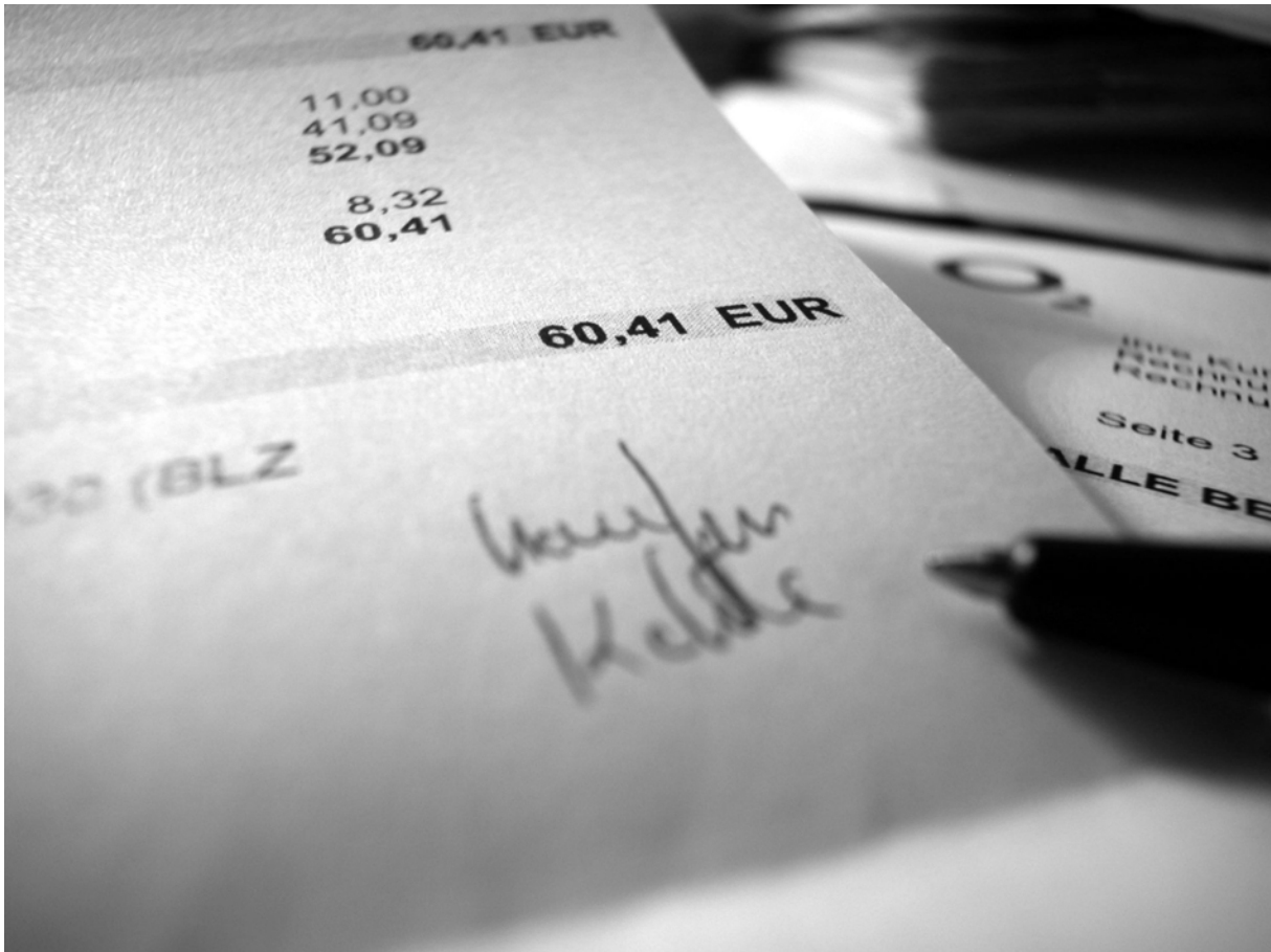
Zahlungsdokumente generieren und exportieren mit RADIX Homebanking