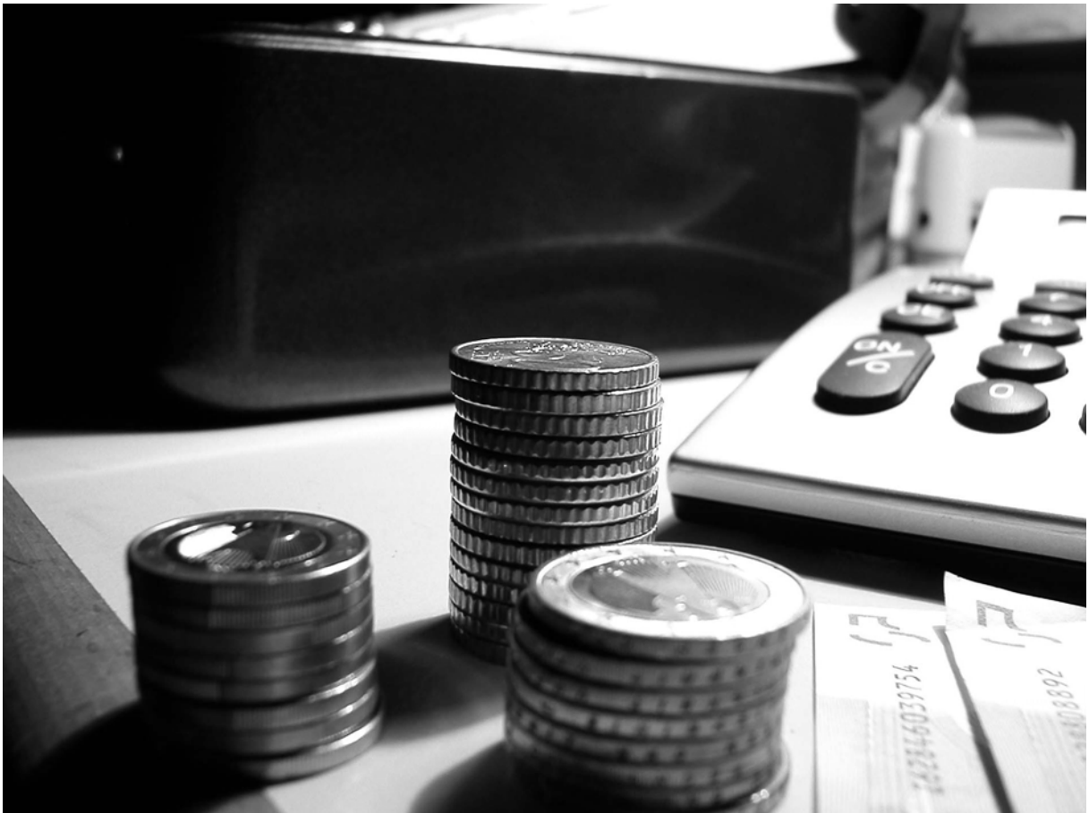
Einfache und effiziente Fakturierung mit RADIX Fakturierung