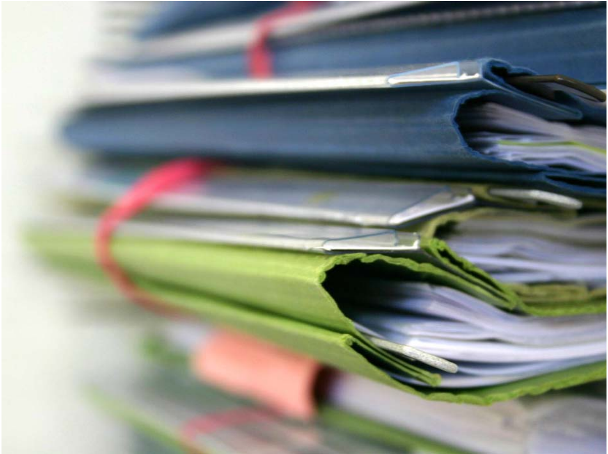
Gestire le offerte in modo completo ed efficiente con RADIX gestione offerte