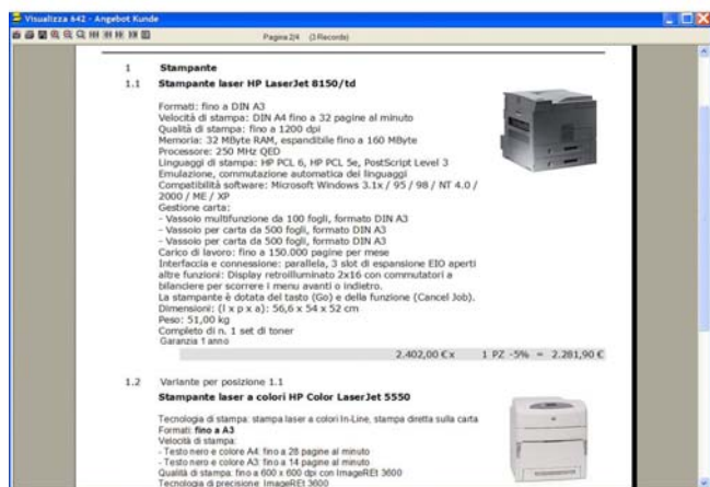
Offerta con varianti, opzioni ed immagini