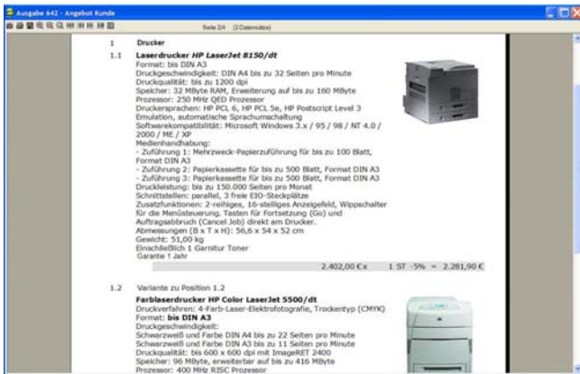
Angebot mit Varianten, Optionen und Bildern